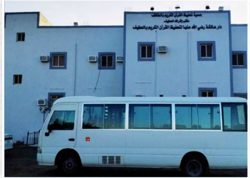
دار عائشة رضي الله عنها