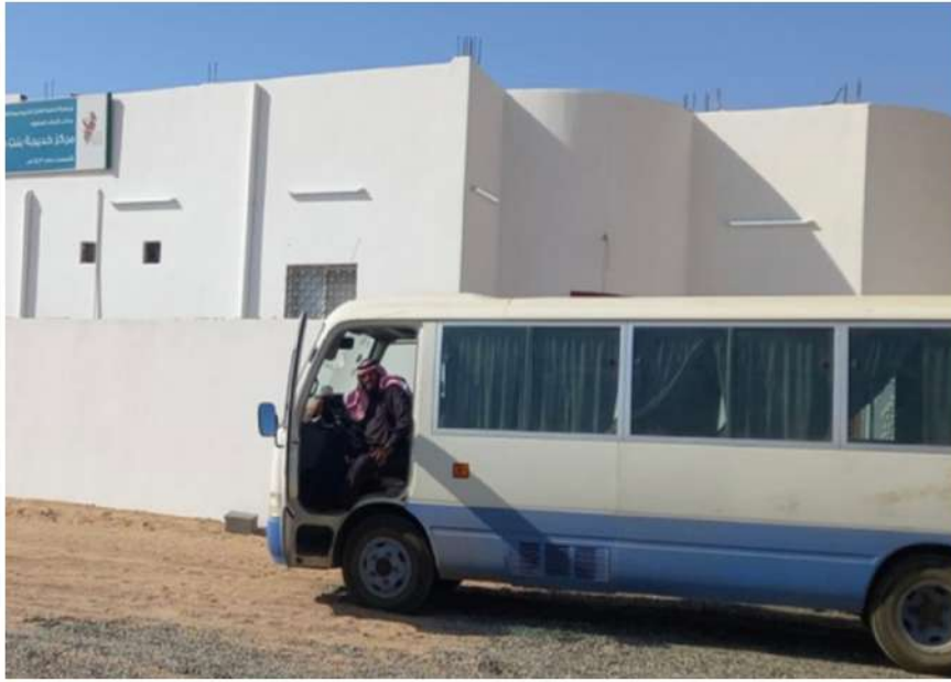
دار خديجة رضي الله عنها